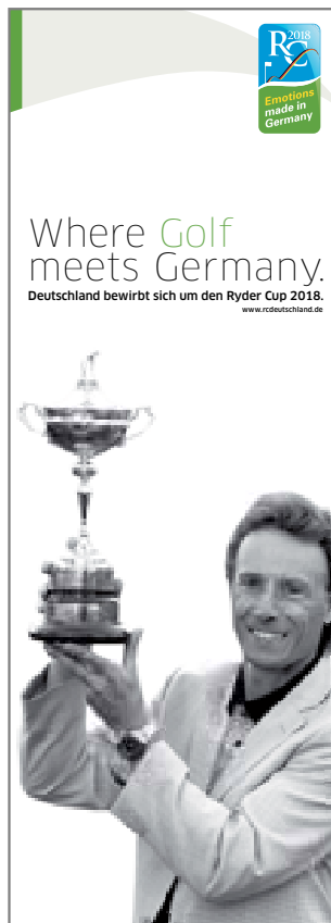
So wirbt Deutschland: Mit Golf-Legende Bernhard Langer