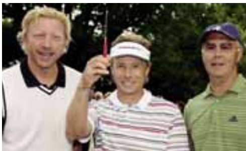
Langer-Helfer: Boris Becker, Franz Beckenbauer